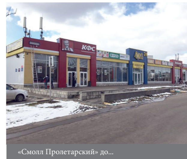
«Смолл Пролетарский» до...