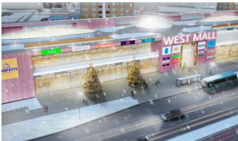
МФК на Большой Очаковской