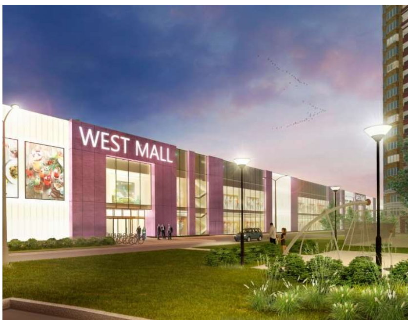
МФК на Большой Очаковской