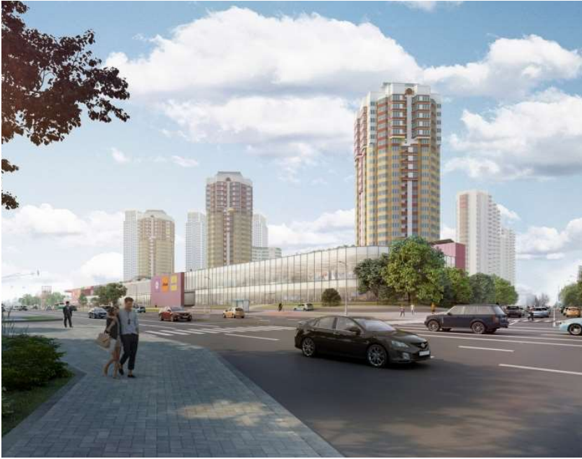
МФК на Большой Очаковской