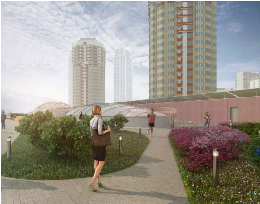
МФК на Большой Очаковской © АМ Сергей Киселев и Партнеры