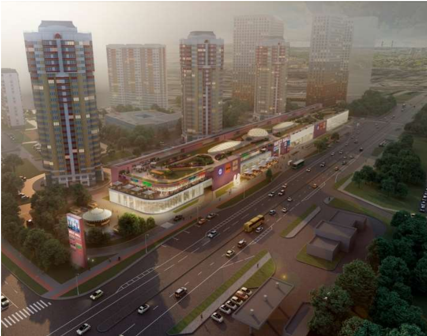
МФК на Большой Очаковской

По вечерам объем ТРЦ должен будет, в основном, светиться изнутри, а днем стекла, как и зенитные фонари, осветят внутреннее пространство естественным светом. Покупатели супермаркета будут бродить меж полок с товарами в окружении стекла «в пол», что, вероятно, даст новые неожиданные ощущения. Впрочем, отчасти стекла будут замаскированы градиентом шелкографии, чтобы эффект прозрачных стен не оказался избыточным.