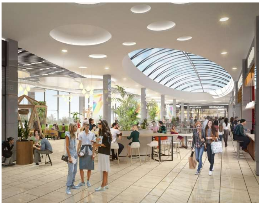
МФК на Большой Очаковской. Зона фудкортов