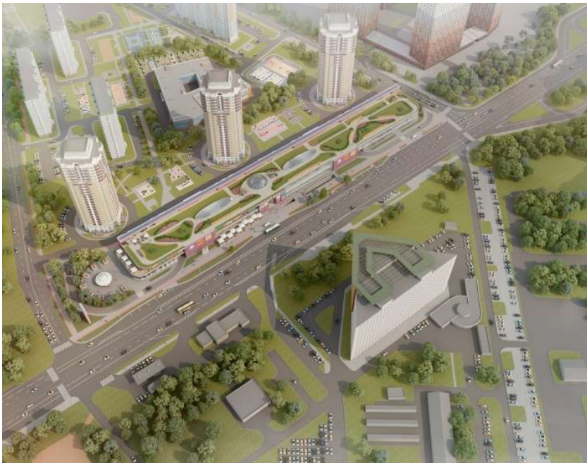
МФК на Большой Очаковской © АМ Сергей Киселев и Партнеры