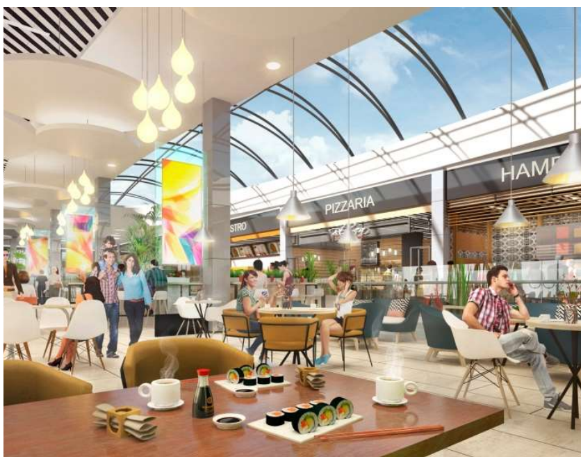
МФК на Большой Очаковской