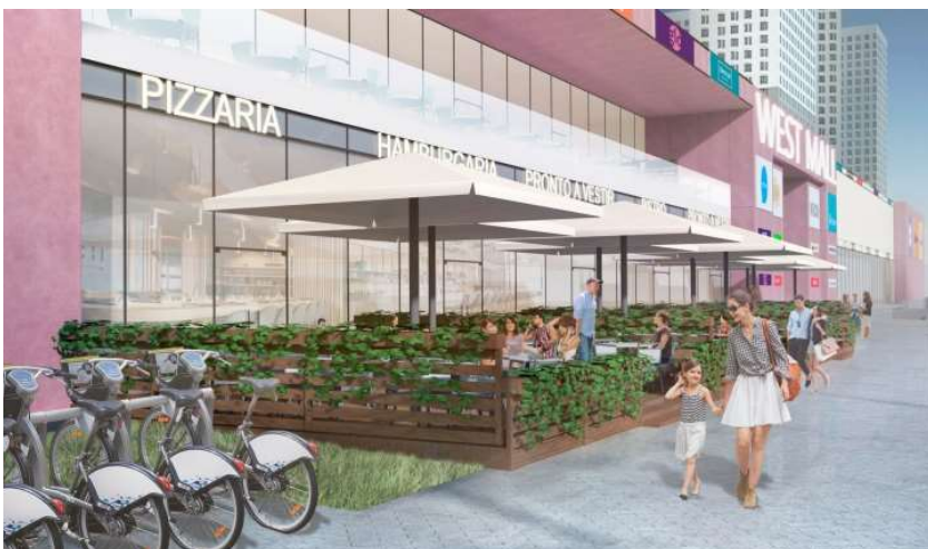
МФК на Большой Очаковской