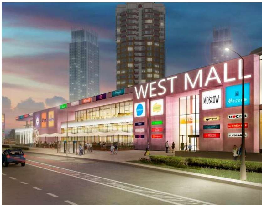
МФК на Большой Очаковской