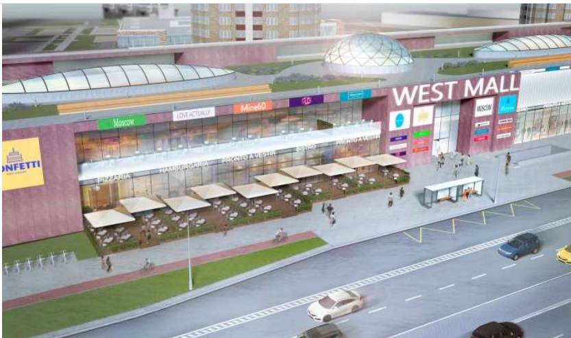
МФК на Большой Очаковской

Слева от входа расположено несколько помещений фуд-холла – ресторанов, в которые можно будет войти как с улицы, так и из пассажа. Планируется, что летом перед ними будут появляться столики кафе, способные хотя бы отчасти придать улице Лобачевского характер городского променада. Здесь же расположилась автобусная остановка.