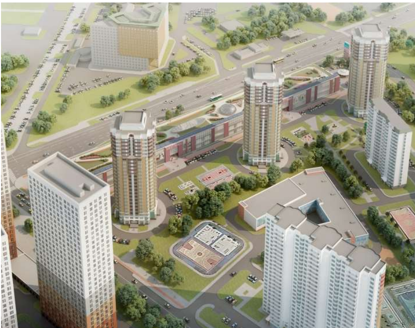
МФК на Большой Очаковской