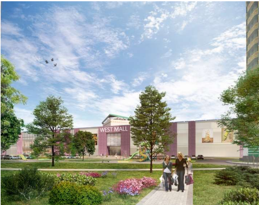
МФК на Большой Очаковской