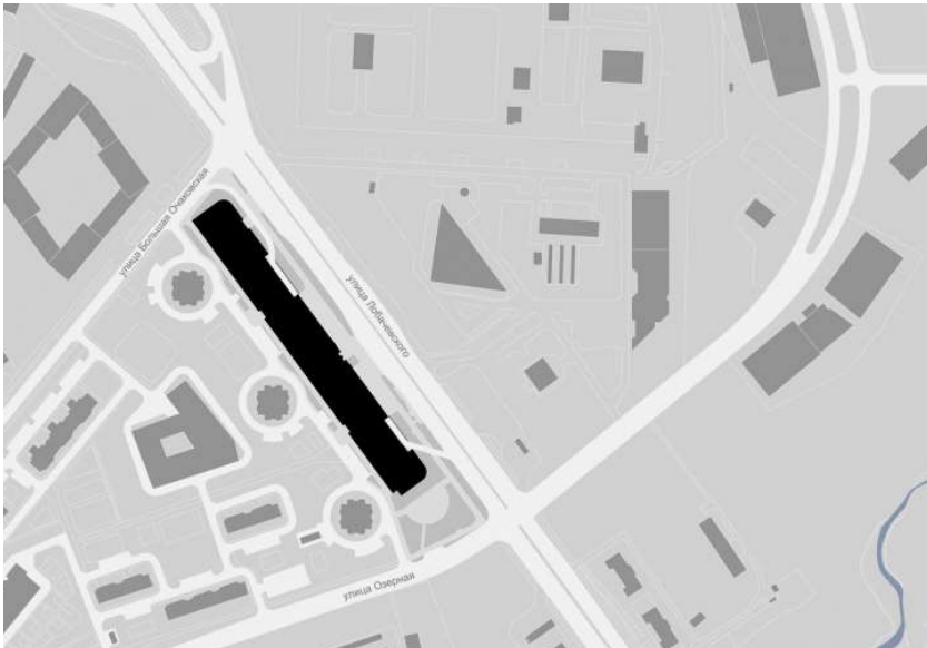
МФК на Большой Очаковской. Генплан

ТРЦ с рабочим названием West Mall, спроектированный архитекторами СКИП, задуман не только многофункциональным, с развитой общественно-развлекательной частью, но и очень экологичным, «зеленым» и «устойчивым» – таким было пожелание заказчика, компании «Гарант-Инвест», активно внедряющей принципы эко-ответственности. Здание планируется сертифицировать по LEED и BREEAM. Требовалось использовать не менее 62 «зеленых» технологий: в этот подсчет включаются технологии строительства, изготовления строительных материалов и параметры дальнейшей эксплуатации здания.