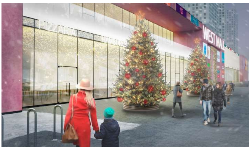
МФК на Большой Очаковской