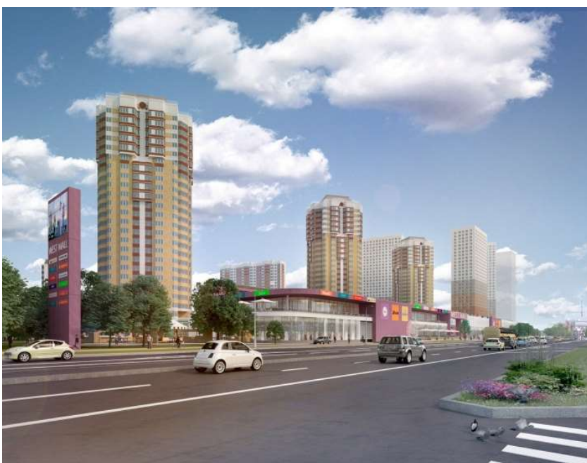
МФК на Большой Очаковской

Итак, узкий протяженный участок проектирования площадью около 1,3 га, длиной больше 350 м при ширине чуть больше 40 м, – вытянут вдоль улицы Лобачевского, крупной шестиполосной московской хорды с интенсивным движением. «За спиной» будущего ТРЦ выстроились в ряд несколько башен, построенных в 2011 году, но несущих на себе отпечаток несложных стилевых предпочтений предшествующей эпохи – первый фронт ЖК «Мичурино». Прямо напротив, на противоположной стороне улицы, располагается массивное здание УВД по ЗАО, его треугольный объем острым углом развернут к дороге.