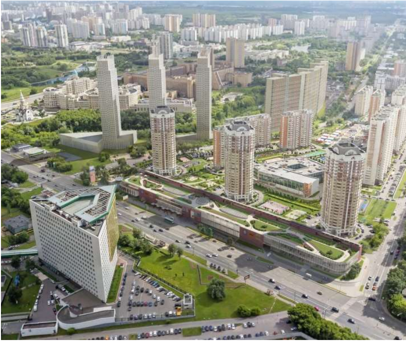
МФК на Большой Очаковской