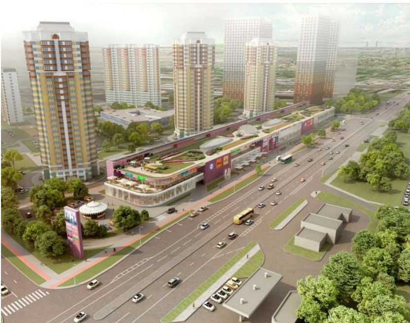
МФК на Большой Очаковской

В торце со стороны Озерной улицы объем ТРЦ отступает ступенькой, формируя просторную летнюю террасу для фудкорта – если не «капитанский мостик», то «палубу корабля».