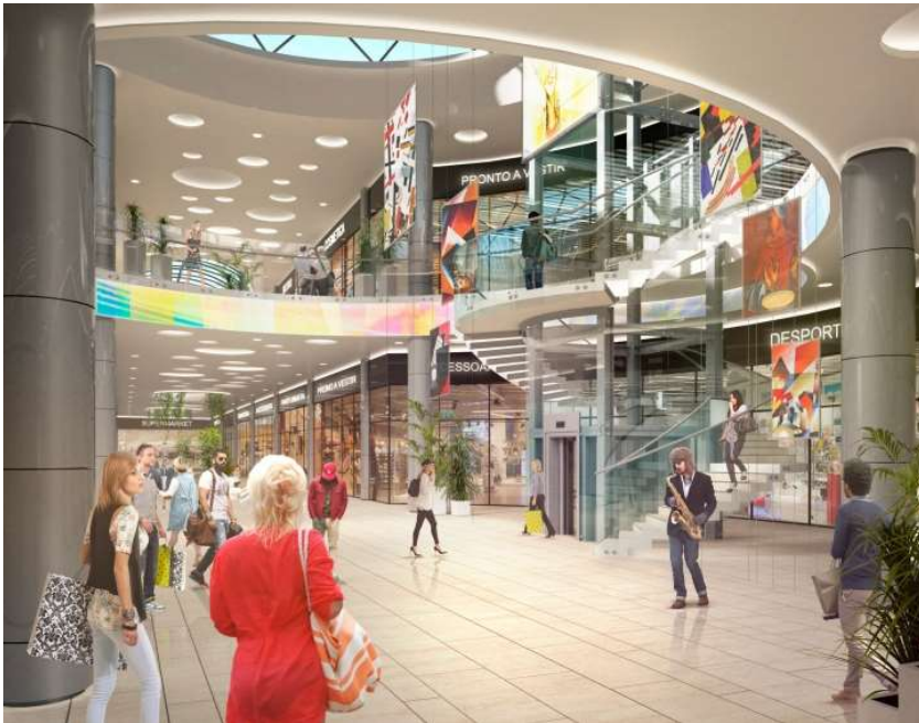
МФК на Большой Очаковской. Атриум

Первый этаж отведен под магазины и супермаркет. Его пространство решено в виде продольной торговой галереи с большим круглым атриумом под зенитным светопрозрачным куполом; он расположен приблизительно по центру протяженного комплекса. Круглый вырез поддержан колоннами круглого сечения; им вторят световые круги на потолке. Лифт окружен почти-винтовой лестницей: она ведет с первого этажа на второй и добавляет пространству интриги.